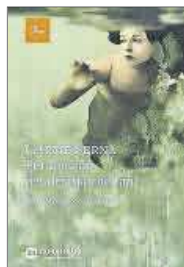
Perdona'm per desitjar-ho tant Carme Serna Proa. 19,90 €

En este vivo retrato de Mercè Rodoreda, que condensa 30 años de indagaciones y lecturas, Mercè Ibarz recorre vida y obra, y se aproxima a la autora como una escritora punk a partir de sus últimos libros publicados, poco leídos y poco valorados durante décadas, desconcertantes por su libertad expresiva y de composición; textos que, por fin, han encontrado a sus lectores en el presente.