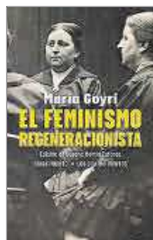
El feminismo regeneracionista María Goyri Renacimiento. 22,90 €

Estos escritos de juventud nos revelan a María Goyri (1873-1954), hija y nieta de madres solteras y claramente influida por el pensamiento de Concepción Arenal, como protagonista directa del incipiente feminismo español de finales del siglo XIX. Filóloga, educadora, defensora del derecho de la mujer a ejercer una profesión que le otorgara independencia económica, todo un referente por descubrir.