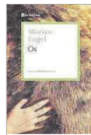
Os Marian Engel La Magrana 20,90 €

En 1976, año de su publicación en Canadá, esta novela sobre una bibliotecaria que se ve obligada a convivir con un oso con el que forja una relación que va mucho más allá de lo esperado entre una mujer y un animal causó un gran escándalo. Ahora llega a las librerías por primera vez en catalán, con traducción de Míriam Cano, convertida ya en un clásico sobre la libertad sexual femenina.