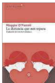
La distancia que nos separa La distància que ens separa Maggie O'Farrell Libros del Asteroide / L'Altra. 22,95 €

La distancia que nos separa, la tercera novela de Maggie O'Farrell, publicada por primera vez en 2004 e inédita hasta ahora en español, cuenta la historia de Stella y Jake. Los protagonistas de esta historia no se conocen, pero ambos huyen de sus vidas: Jake busca un lugar tan remoto que no aparece en ningún mapa, y Stella se esconde de algo cuyo significado sólo su hermana Nina puede entender.