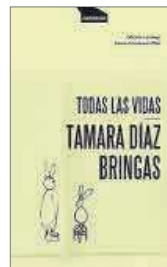
Todas las vidas Tamara Díaz Bringas Consonni 19,90 €