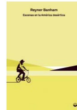
Reyner Banham Escenas en la América desértica Puente Editores, Barcelona, 2021 272 páginas; 22 euros