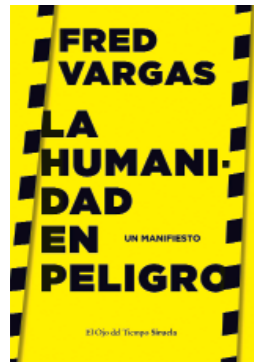
Fred Vargas La humanidad en peligro Siruela, Madrid, 2020 296 páginas; 20 euros

Que el calentamiento global ha dejado de ser el tema de científicos melancólicos y de ecologistas agoreros se demuestra por los cientos de títulos que estos últimos años se han dedicado al problema. Títulos firmados por especialistas pero también por filósofos, economistas e incluso literatos que han puesto su habilidad narrativa al servicio de la ecología. Es el caso de Fred Vargas (seudónimo de Frédérique Audoin-Rouzeau), reconocida autora de novela negra que hace diez años escribió «La humanidad en peligro», un brevísimo manifiesto que resultó tan convincente como para ser leído en la inauguración de la COP24 en 2018. Ahora se publica una edición ampliada del mismo, tan mesurada como el texto original pero enriquecida con multitud de datos y que funciona como un estupendo alegato contra la desinformación.